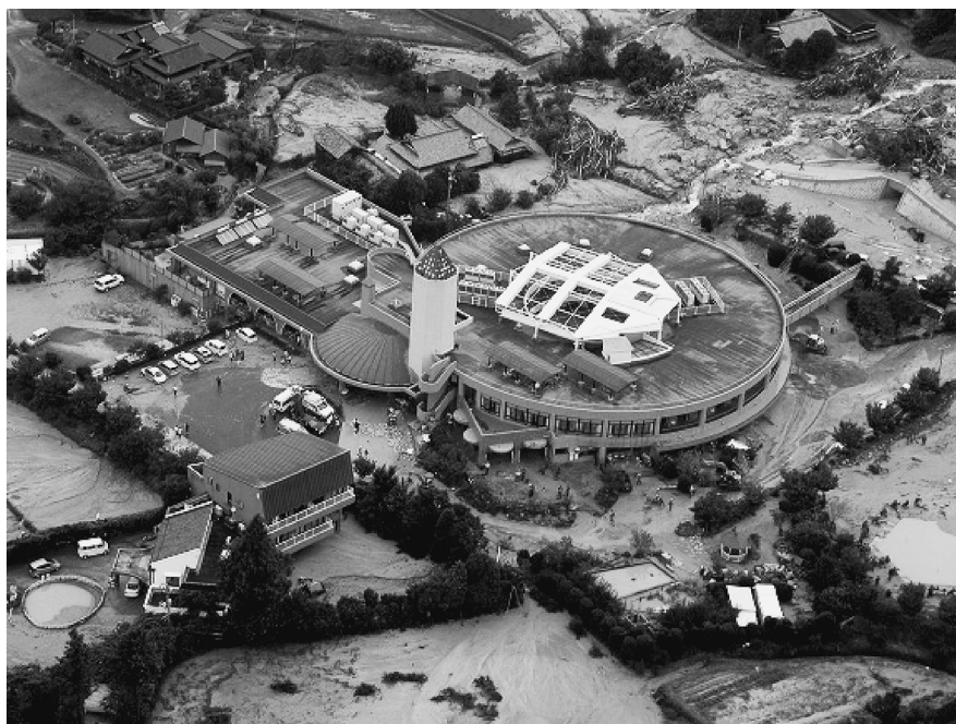
写真 1-1-2 特別養護老人ホームライフケア高砂