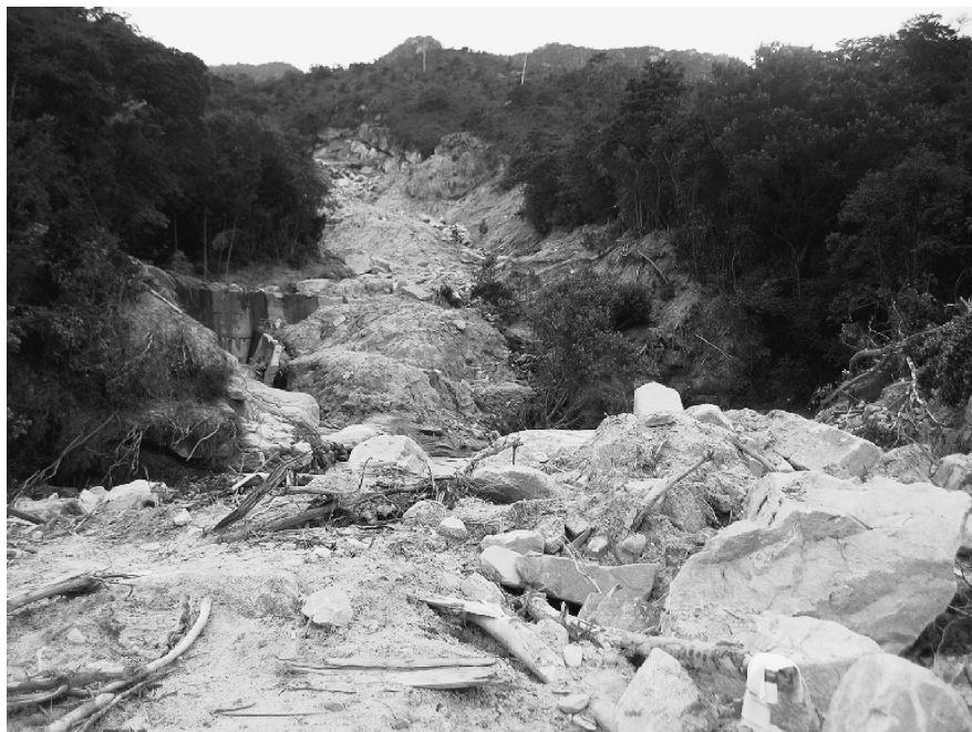
写真 1-1-1 国道 262 号防府市勝坂の土石流現場

また、土砂崩れも多数発生し、道路を支える構造物（盛土、擁壁等）や法面の崩壊など山口・防府地区を中心に甚大な被害が発生した。