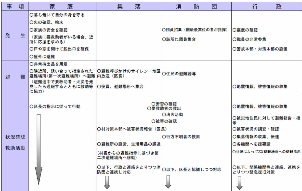
図 3-4 家庭・集落・消防団・行政の震災応急対策一覧