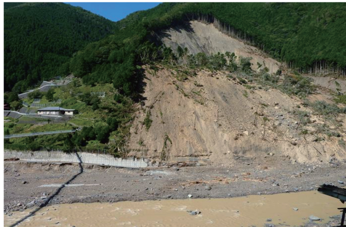
写真3 深層崩壊ともいうべき山腹崩壊

また、道路が寸断され、孤立集落や地すべりの可能性があるため避難を余儀なくされる集落が発生した。深層崩壊ともいうべき山腹崩壊（写真3）は、消防団格納庫や消防自動車（写真4）までも流した。