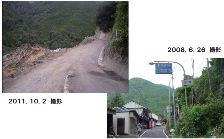
写真2 宇井地区の被災前後

また、道路が寸断され、孤立集落や地すべりの可能性があるため避難を余儀なくされる集落が発生した。深層崩壊ともいうべき山腹崩壊（写真3）は、消防団格納庫や消防自動車（写真4）までも流した。