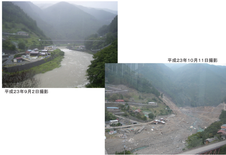
写真1 左岸宇井地区から撮影した右岸清水地区の被災前後