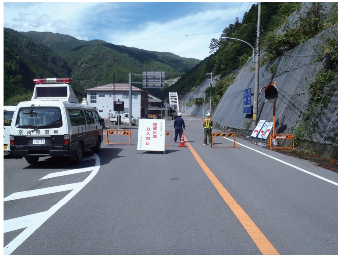
写真5 警戒区域の設定

赤谷地区において土砂ダムの形成が確認されたため、9月6日には国土交通省により土砂災害防止法に基づく緊急調査が実施され、平成23年9月8日付けで土砂災害緊急情報第1号が通知、さらに9月16日には土砂災害緊急情報第5号が通知され、災害対策基本法第63条により大塔町赤谷地区、清水地区、宇井地区（対象世帯49世帯93人）に警戒区域の設定（写真5）が9月27日まで（赤谷地区は2月8日まで）行われた。