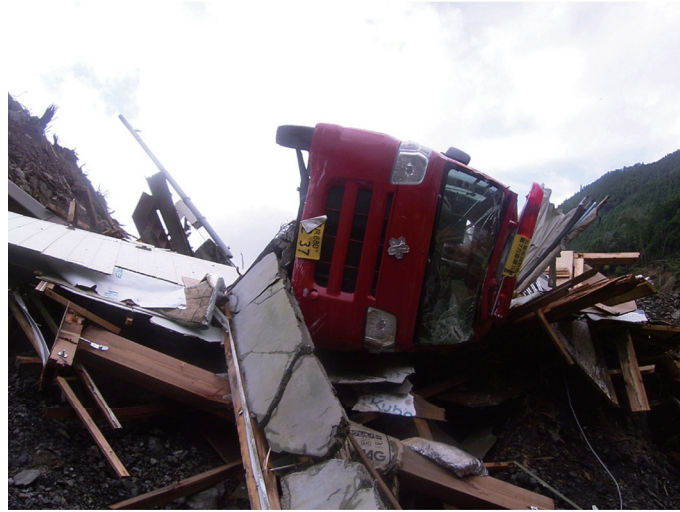
写真4 格納庫ごと転落した消防車

赤谷地区において土砂ダムの形成が確認されたため、9月6日には国土交通省により土砂災害防止法に基づく緊急調査が実施され、平成23年9月8日付けで土砂災害緊急情報第1号が通知、さらに9月16日には土砂災害緊急情報第5号が通知され、災害対策基本法第63条により大塔町赤谷地区、清水地区、宇井地区（対象世帯49世帯93人）に警戒区域の設定（写真5）が9月27日まで（赤谷地区は2月8日まで）行われた。