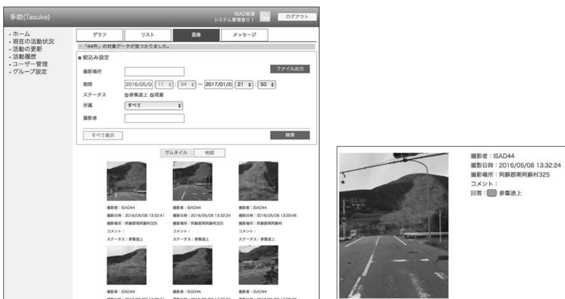
図1 熊本地震調査の際に使用した情報収集ツール「多助」の本部画面