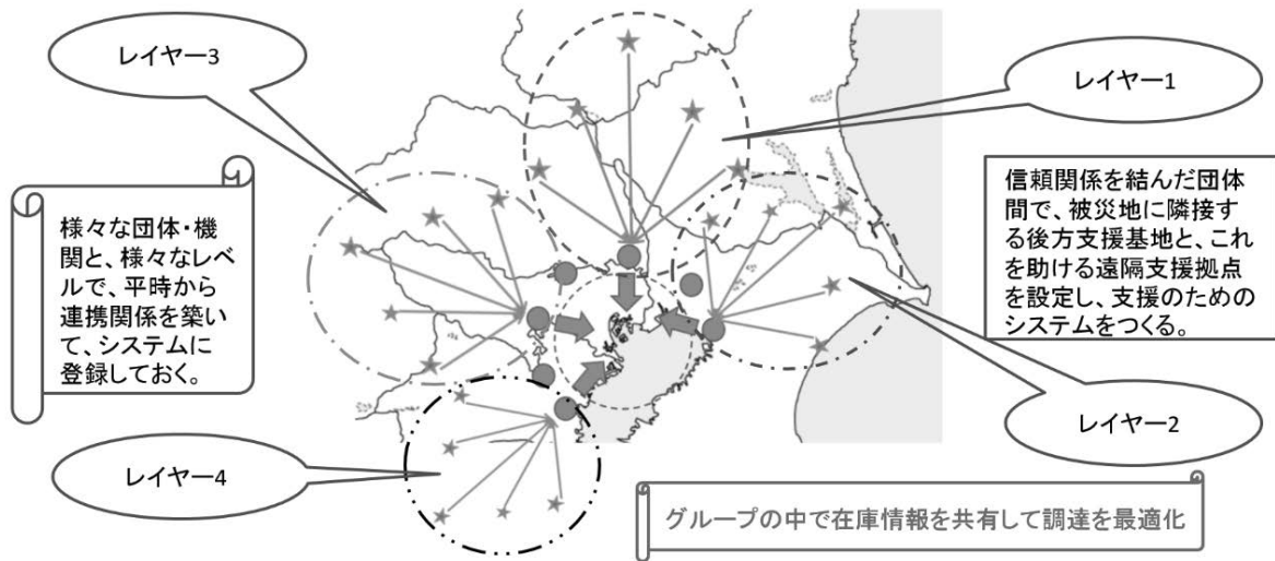
図6 首都直下型地震に備える資源動員ネットワーク

決行動が豊かに展開する社会こそが、レジリエンスを備えた社会なのではなかろうか。そして、そうした社会システムを見据えた行動の積み重ねこそが、日本に災害レジリエンスを備えた社会システムを実装する上で、重要なポイントとなる。