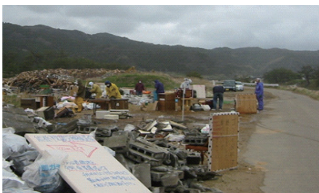
写真 10.1.1 災害ゴミを仕分けするボランティア

いずれにせよ、常に「被災者にとって必要な活動を組み立てていく」という視点と「危険を伴う活動」であるという認識をもって、自治体間、自治体－災害VCとが状況認識を共有しつつ、活動を進めていくことが期待される。