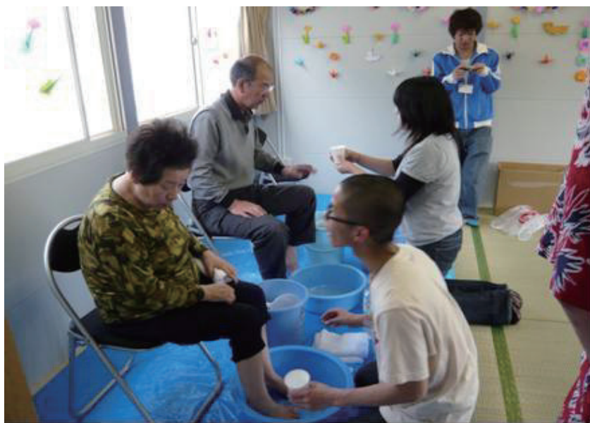
写真 10.3.1 「中越・KOBE 足湯隊」による足湯サービス（穴水町の仮設住宅にて）

こうした被災者に寄り添う活動と、災害VCを通じた活動とが情報を共有し、連携していくことで、潜在化しやすいニーズの発見、復興を視野に入れた支援プログラムの開発など、新たな可能性が開かれていくことを期待したい。