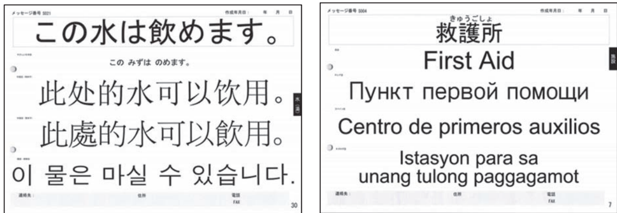
図表2 災害時多言語表示シート