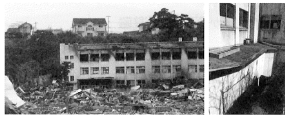
図3 津波避難ビルに延焼し裏山に再避難した事例 (石巻市立門脇小学校、左：筆者撮影、右 4) )

翌日、朝 10 時ぐらいに東京消防庁の隊員らがケアハウス内の人々の生存を確認しているが、瓦礫が支障となってその場での救助は行われなかった。その後、消防団が瓦礫を片付けたのち、救助されている。なお、瓦礫の合間を縫って救助されたため移動経路は不明である。最終的にケアハウスの人々が救助されたのは昼過ぎであった。