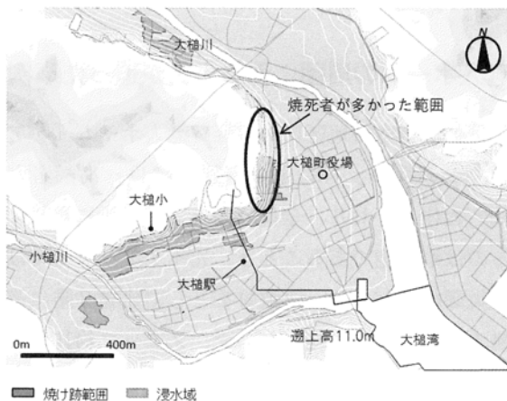
図1 大槌町の津波火災による焼死者が多かった範囲

沿岸部の住宅地ではLPガスボンベが多数使われていたが、津波は衝撃力をもって家屋やボンベを押し流した。その際、ボンベの配管部を損傷させ可燃性ガスを噴出させた。家屋の中に入ってきたボンベ、水中に浮かんでいるボンベ、瓦礫の下にあったボンベ等からシューという可燃性ガスの噴出音を聞いたという被災者の証言もある。このような家屋の2階や屋根の上に取り残されていた被災者が、周囲でボンベが爆発する音を聞き、火