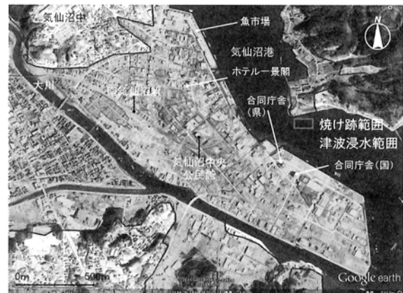
図2 気仙沼市港湾地区における津波避難ビル

宮城県気仙沼市の港湾地区では、周辺に高台がなく、津波避難ビルが指定されており、図2に示されるように気仙沼中央公民館、合同庁舎(国、県)、魚市場、ホテル等に津波に備えて多くの地域の人々が避難して来ている。津波が襲来した際、この地区の先端にあった石油タンク群が津波によって破壊され、気仙沼湾内に石油類が流出し、海面上の瓦礫などとともに出火して海面上が広く炎上し、燃焼しながら漂流する瓦礫などが津波避難ビルの近くまで迫った。