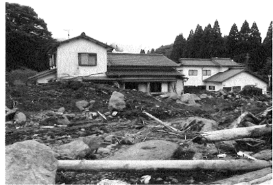
写真-1 阿蘇市一の宮町坂梨地区の土砂災害

阿蘇地方の土砂災害では、死者・行方不明者22名、全・半壊家屋30棟という被害が発生している(国土交通省砂防部調べ)。これら悲惨な土砂災害を発生させた土砂の移動現象は、崩壊や崩壊土砂の流動化に伴う土石流である。