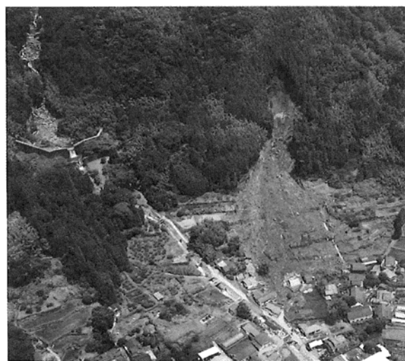
写真-2 砂防堰堤(写真左端)の災害防止効果 (中園川)

今回被災した阿蘇地方のうち、阿蘇市一の宮町地区では平成2年7月2日の豪雨により土石流が多発し被害が生じていた。そこで再度災害防止対策として砂防堰堤等の防災施設が施工された。