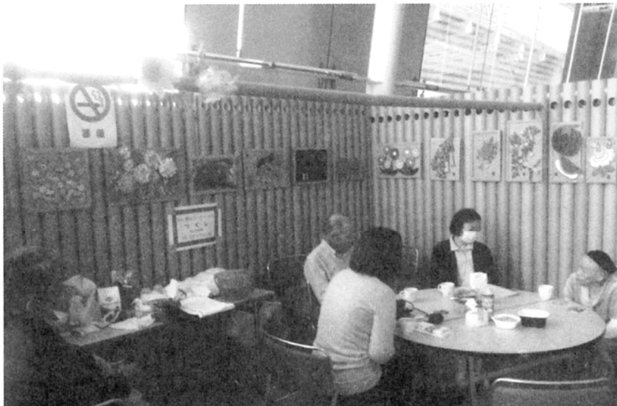
写真1 ビッグパレットふくしま避難所におけるサロン(3号店「つくし」)

こうしたサロンでの活動の経験から、交流の場を作ったり自治活動を促進したりするような仕組みを組織的、体系的につくり出すことが必要なのではないかと考え、生まれたのが「おだがいさま