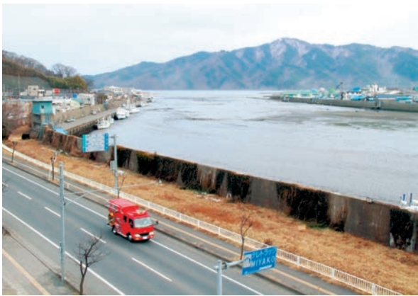
写真1 3月11日午後3時18分。底が見えるほど潮が引いた閉伊川。避難を呼び掛ける消防車が防波堤沿いを走る

いことから、とっさの判断で庁舎の1～2階の来訪者を職員に案内させ6階の大会議室に避難誘導させた。これらを行いながらも大津波警報発令時の危機管理マニュアルに従い、市内各所に指定してある避難所の開設を担当する初動班はそれぞれの担当避難所へ出動していった。その後庁舎テラスから水面監視していた職員から水面に著しい変化が表れているとの報告があり、確認するためテラスに出てみると、普段3メートル程の水位のある川が底を見せており、急激にその範囲が拡大している状況で、大津波の襲来を覚悟した。