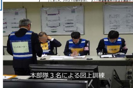
本部隊3名による図上訓練