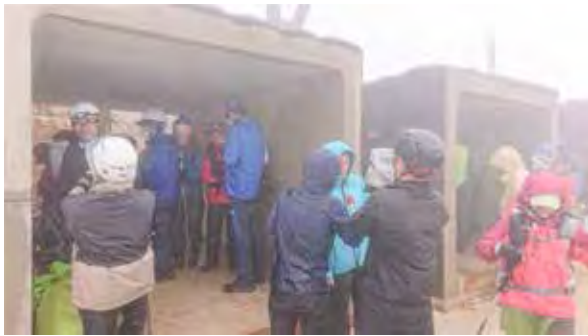
図4 噴火を想定した御嶽山の登山者参加型の避難訓練の実施時の様子

また沢山の課題が、見つかった。避難訓練の開始直前に悪化した天候のため、濃霧と風で放送が聞こえにくかった。参加した登山者の中には耳の不自由な方が居た。避難訓練を通して、噴火が起こった時に、どのように登山者に噴火を周知するのか、新たな課題が認められた。