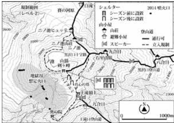
図1 御嶽山の山頂部における登山道と避難施設

指して、御嶽山防災力強化計画を制定した（木曾町・王滝村・長野県、2018；2021改定）。この計画に基づいて、御嶽山域の避難施設の整備と情報伝達設備の整備は概ね2022年度内に完了した（図1）。