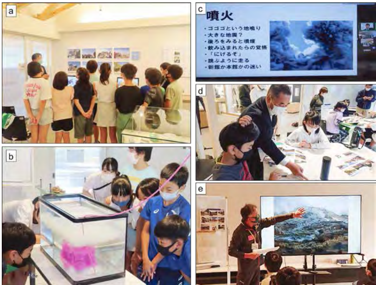
図3 大学、行政、登山者、事業者・住民による火山防災タイムライン学習の様子。 御嶽山ビジターセンターにて。

御嶽山防災力強化計画に基づき、整備を進めてきた防災シェルターの認知度と運用方法および登山者の避難に対する行動と意識を調査するため、名大火山研究施設は協力して、噴火を想定した登山者参加型の避難訓練を木曾町が実施した。噴火を想定した避難訓練や防災訓練は、救助・救護を目的とした行政機関向けの訓練や住民向けに実施された事例はあるが、登山者が参加しての避難訓練に関して全国的に類は少なく、登山者の避難行動の科学的データが得られたのは初めてである。分析結果は別途報告するが、シェルターのある